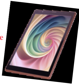
TAG-TAB Kids II